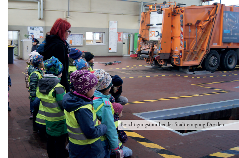
Besichtigungstour bei der Stadtreinigung Dresden