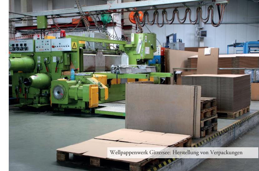
Wellpappenwerk Gittersee: Herstellung von Verpackungen

Die Unterrichtsstunden, Exkursionen und Projekttag/-wochen sind einzeln und in Kombination buchbar.