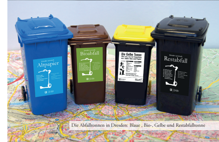
Die Abfalltonnen in Dresden: Blaue, Bio-, Gelbe und Restabfalltonne